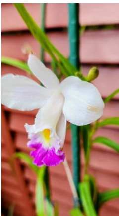
5月我が家の蘭の数々