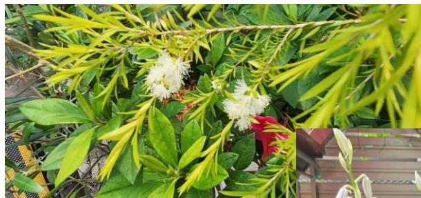
我が家の4月の花達