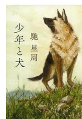
【少年と犬】 今月の推し本、愛犬家必読です。