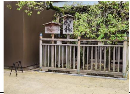
有名な飛梅 元気が無いのが心配↑