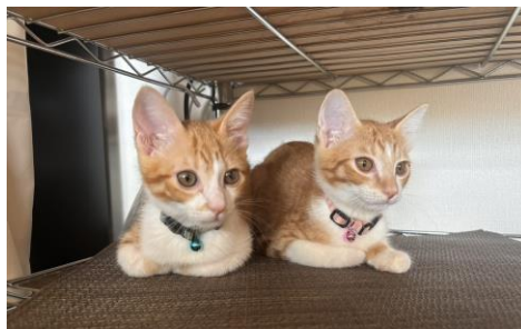
平良家の2にゃんず可愛い〜