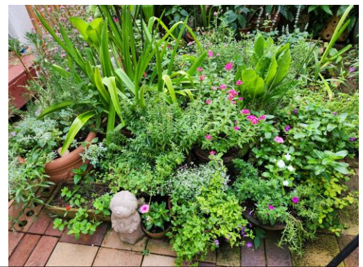
花は少ないがランは綺麗に咲いてくれた