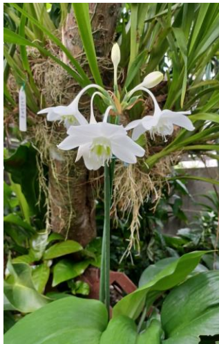
アマゾンリリーの花 買い求めて3年目に開花