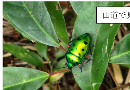
山道で見かけたカナブン