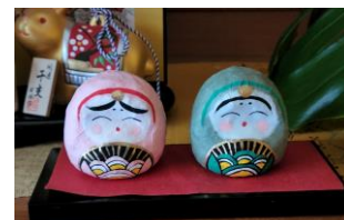
我が家の張り子のひな人形