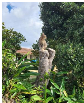
やちむんの里 パトロール中の猫