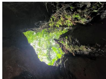
CAVE OKINAWA の写真 5点 時計回り→ライトアップ→紅白岩→♡の天井→入口