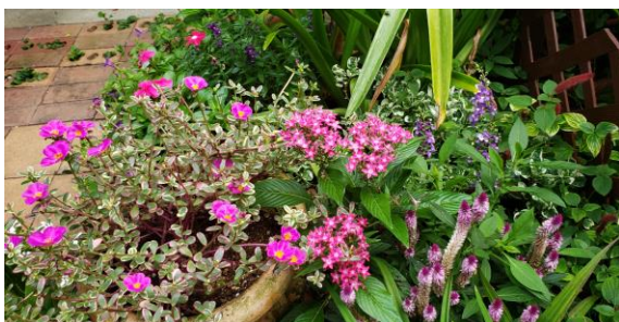
自宅の庭 夏の暑さにもめげず咲いている花々