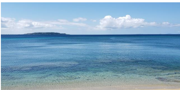
国道 58 号線 大宜味村 古宇利島を望む

ホームページも是非ご覧くださいませ。お得な情報が一杯です。アドレスは http://www.uom.co.jp です。