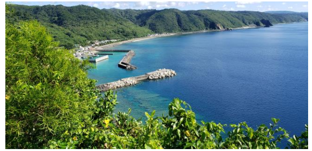
国頭村 茅打バンタから 宜名真漁港を望む