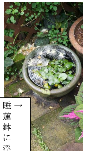
か → 睡蓮鉢に バナのサガリ 花が浮