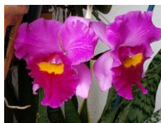
カレアも咲きました