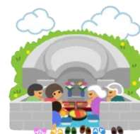
←宜野座オープンガーデン