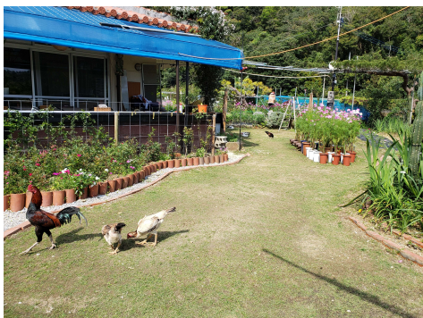
名護東海岸のオープンガーデン の写真4点