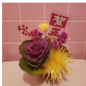
お正月飾り 玄関とトイレ (特にト イレがお気に入り)