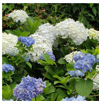
よへなあじさい園 4点